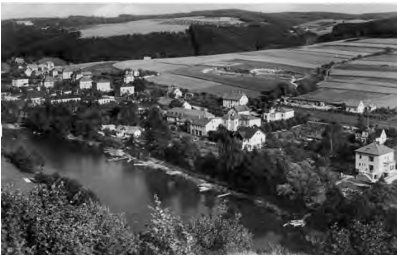
Hotel Praha na historické fotografii

soubor tří pozemků. Změna vychází ze záměru studie žadatele o změnu ÚP, který intenzitu bytové zástavby podstatně snížil - změnil na komplex devíti řadových rodinných domů (9BJ) se zahradami a garážemi. Obec se záměrem souhlasí zejména z důvodů podpory možností vzniku bytových jednotek pro trvalé bydlení.