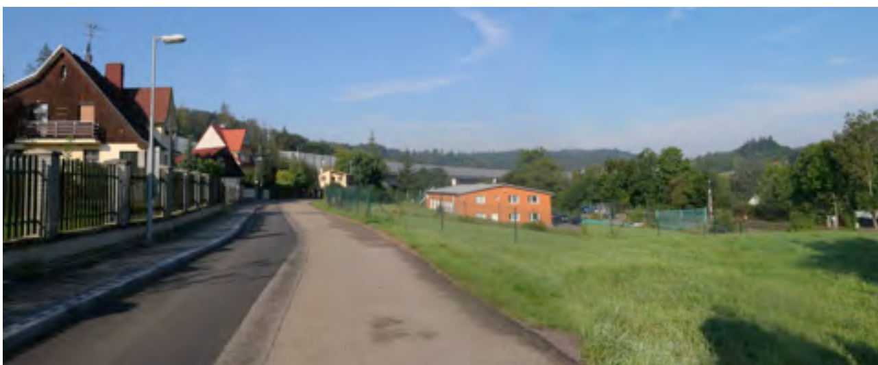
fotografie lokalit změn - I/Z2 (září 2022)