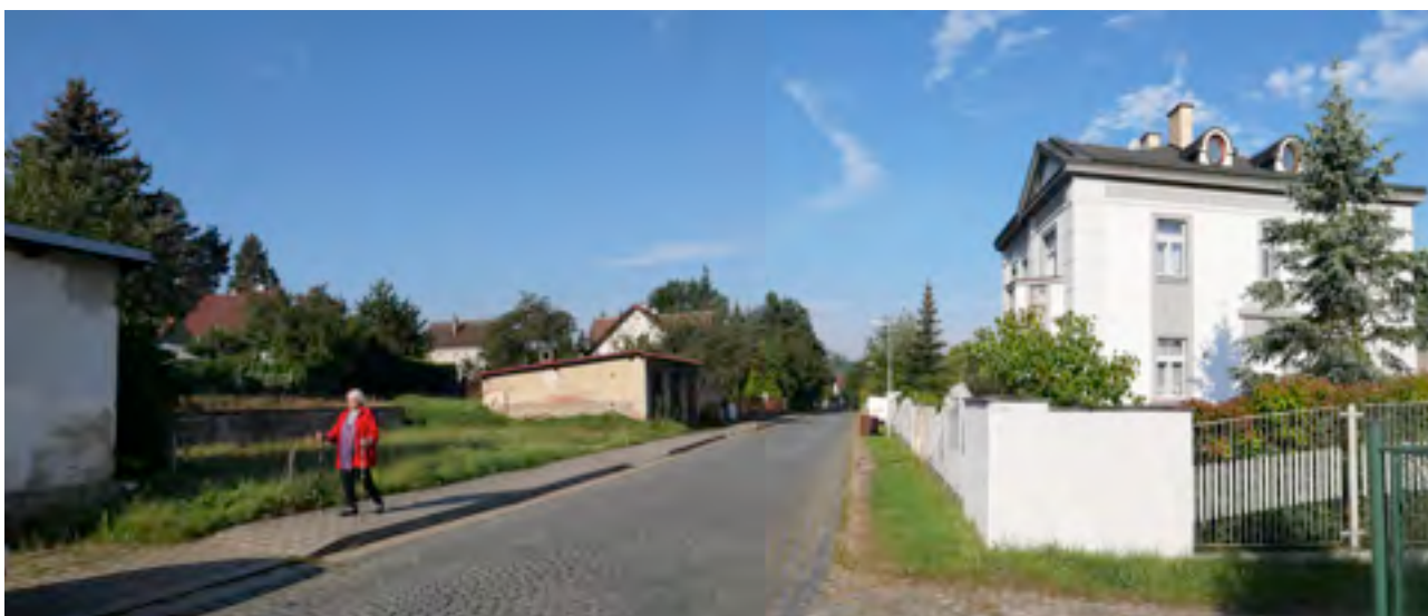
fotografie lokalit změn - I/Z1 (září 2022)