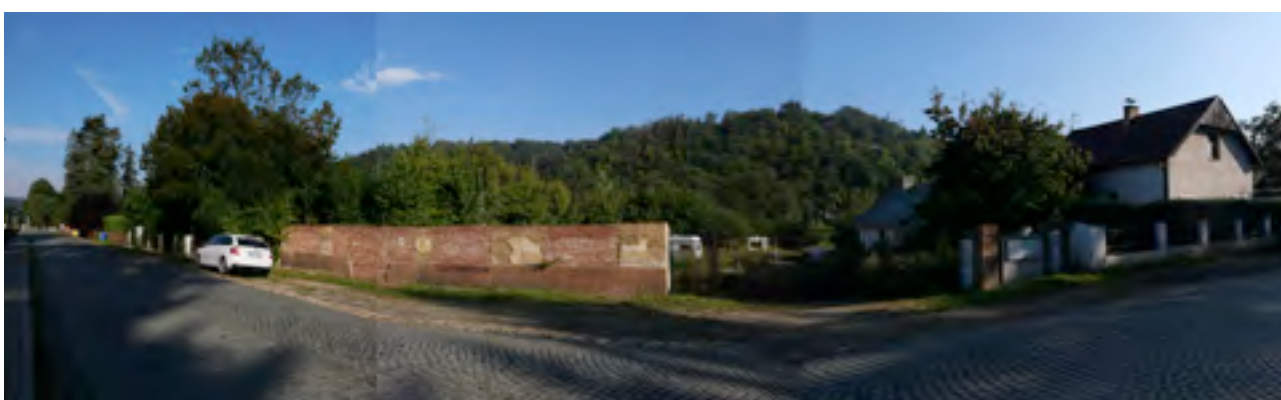
fotografie lokalit změn - I/Z4 (září 2022)